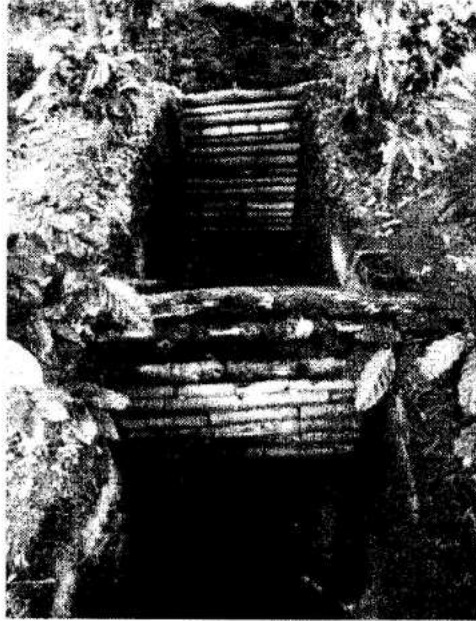
Foto 3: Entarimado realizado con tarros de bambú para impedir que la tierra depositada en el re-entierro parcial de la Operación CC-2 c se esparciera en el área donde se visualizan los 2 empedrados (Flores 2013).

Foto 2: Las flechas en color blanco indican la posición en que fueron registradas las piezas de lítica mayor, también se puede observar en el área más profunda, parte del empedrado 2 registrado debajo del empedrado 1 (Flores 2013).