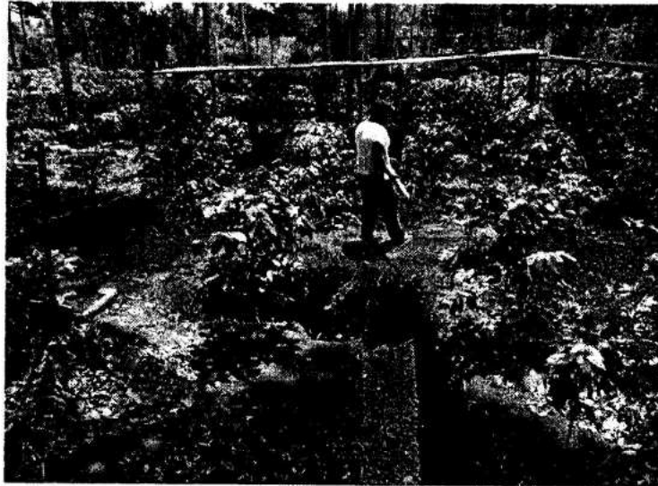
Foto 4: Plantación de café en el área de estudio, las mismas deben de ser cuidadas durante el proceso de excavación (Flores 2013).